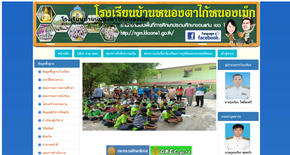
ภาพที่ 1 หน้าเว็บไซต์โรงเรียนบ้านหนองตาไก้หนองเม็ก

https://data.bopp-obec.info/web/home.php?School_ID=1040050110