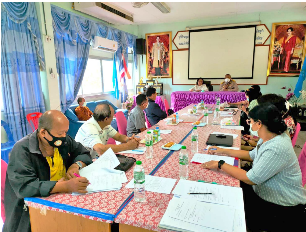
ภาพที่ 2 การประชุมร่วมกันในการกำหนดมาตรการฯ ระหว่างบุคลากรและผู้มีส่วนได้ส่วนเสีย

https://data.bopp-obec.info/web/home.php?School_ID=1040050110